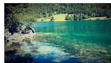
Blick über den Hintersteiner See

Dauer: 4 Std. 500 hm↑ 500 hm↑ Strecke: ca. 14 km